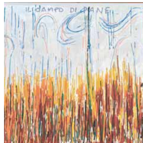
Mario Schifano, Il campo di pane

Come accennato, anche per il 2025 il progetto ha ricevuto un riconoscimento finanziario per la sua specificità e utilità nell'ambito del "Programma cantonale di promozione dei diritti di prevenzione della violenza e di protezione di