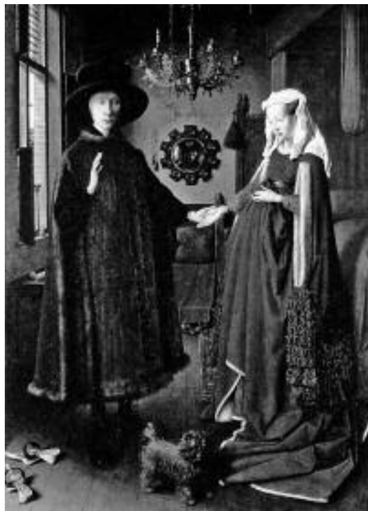
I CONIUGI ARNOLFINI, Jan Van Eyck, olio su tavola