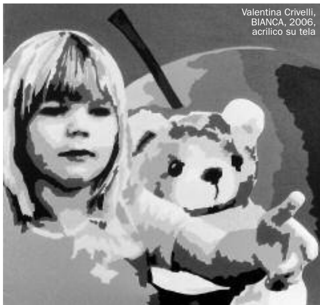
Valentina Crivelli, BIANCA, 2006, acrilico su tela

Per concludere mi preme segnalare che andrebbero coinvolte tutte le Comunità e le Chiese (e non solo le due citate). La scuola già ora negli agglomerati si trova ad insegnare a bambini provenienti da molteplici paesi e culture diverse; l'educazione sessuale in senso ampio interessa anche loro perché vivono e interagiscono nella nostra realtà. Senza il coinvolgimento delle famiglie straniere si rischia di perdere un tassello importante del progetto. Per avvicinare queste famiglie a temi delicati e complessi la scuola potrebbe far capo ai mediatori culturali.