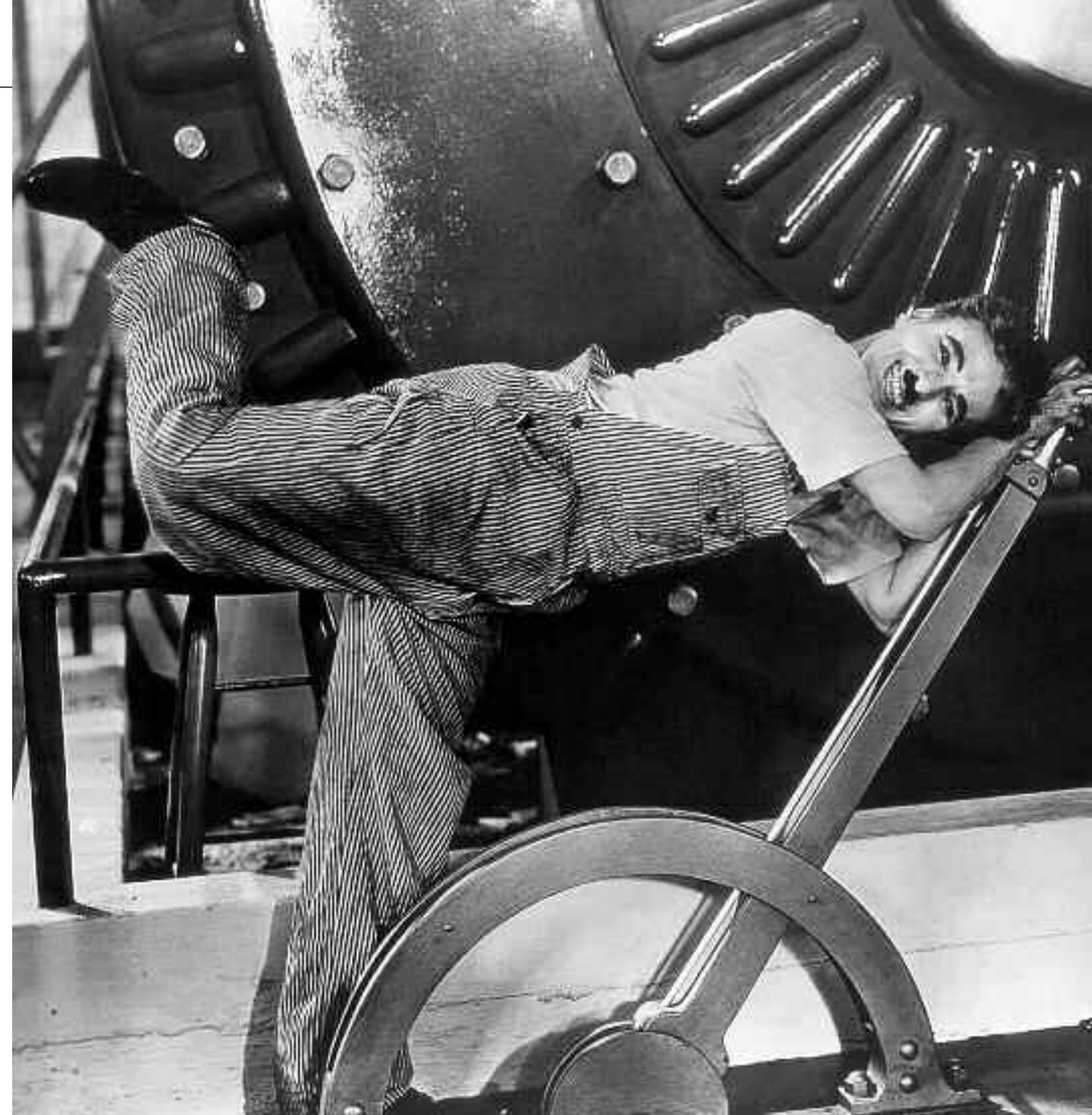
Fotogramma tratto dal film Tempi moderni , Charlie Chaplin

Comunità familiare in collaborazione con l'ACSI - Associazione consumatrici e consumatori della Svizzera italiana - vi invita a partecipare alla serata