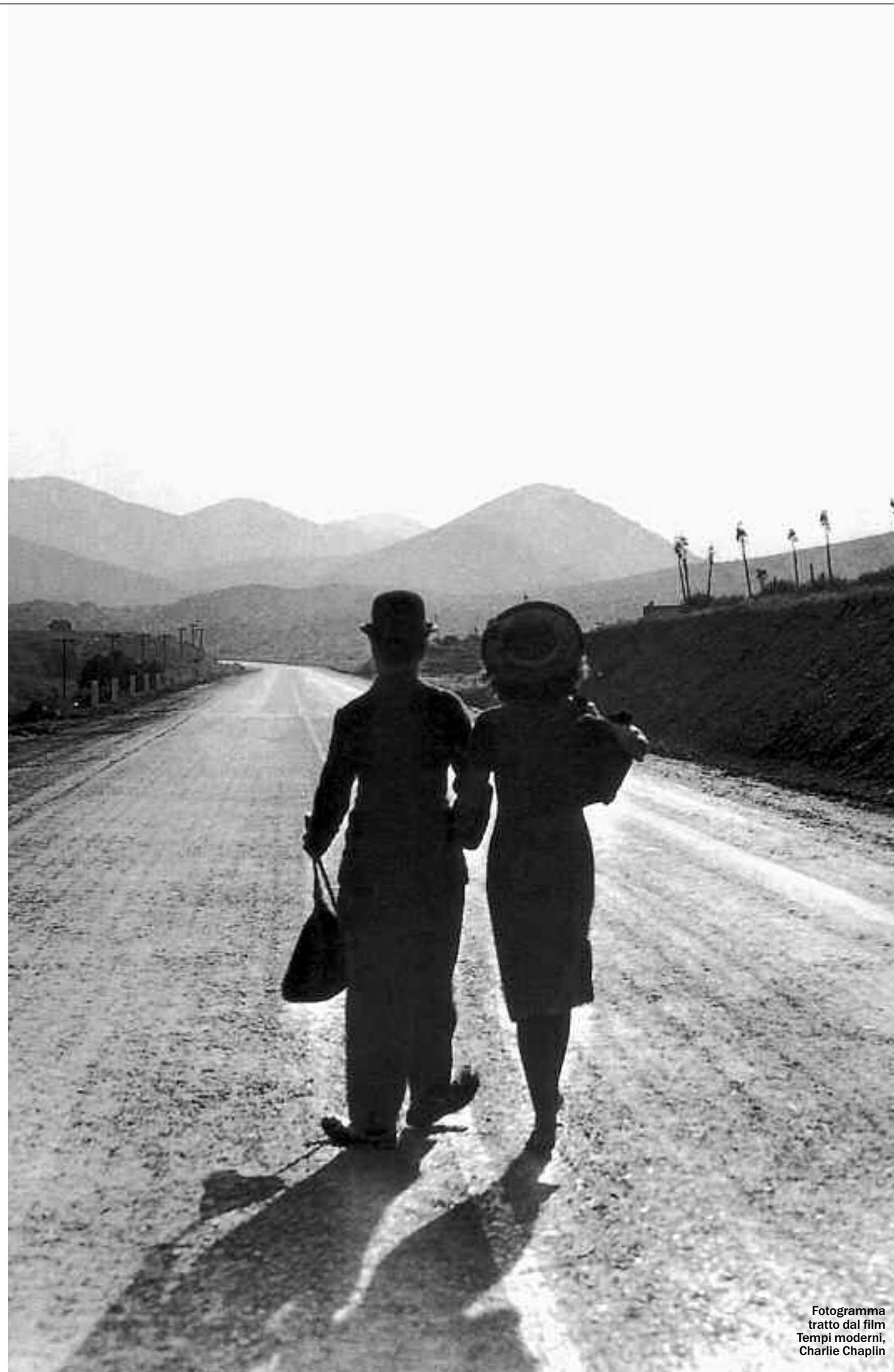
Fotogramma tratto dal film Tempi moderni, Charlie Chaplin

Associazione Progetto Genitori Mendrisiotto e Basso Ceresio Via S. Damiano 2e 6850 Mendrisio Tel/Fax 079 375 37 91 www.associazioneprogettogenitori.com e@mail: apgenitori@bluewin.ch oppure info@associazioneprogettogenitori.com Per contributi c.c.p 65-221928-4