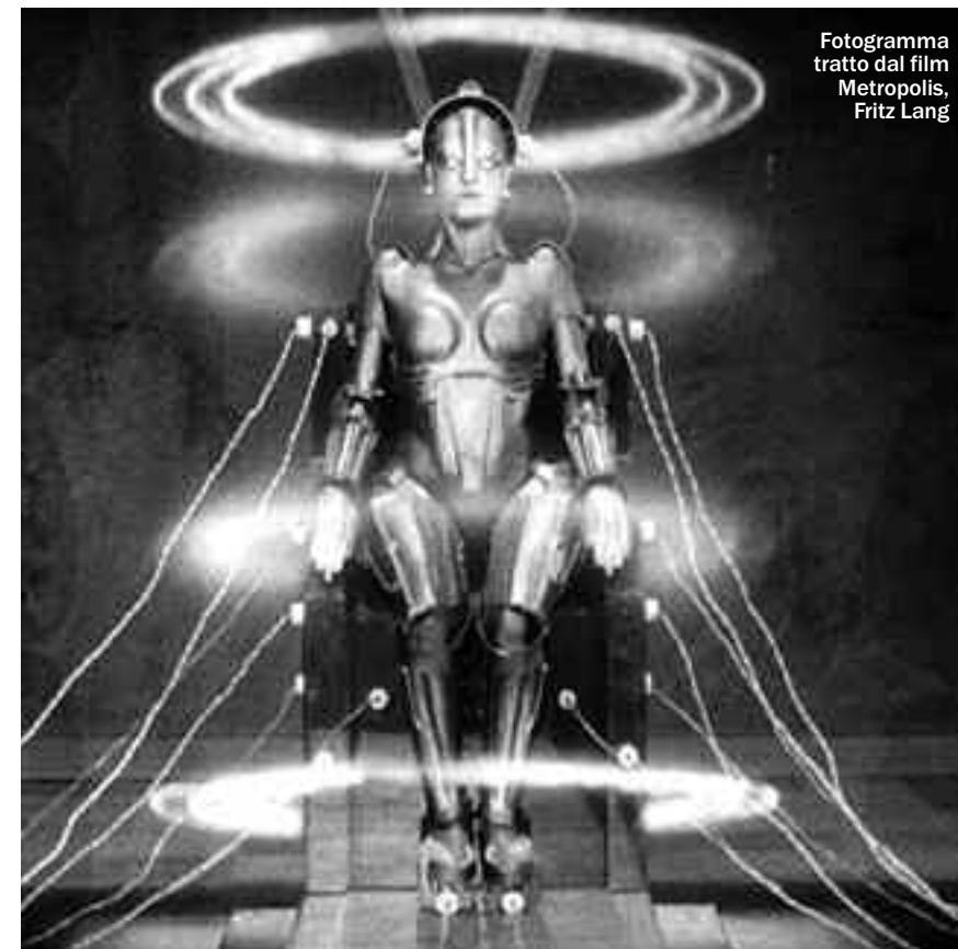
Fotogramma tratto dal film Metropolis, Fritz Lang

mitata di ogni genere di prodotti nonché da nuove possibilità e abitudini di comunicazione. I temi sollevati andranno ora dibattuti a livello nazionale, nell'auspicio possano confluire in una politica delle dipendenze che superi la strategia tesa a contrastare l'uso illecito degli stupefacenti.