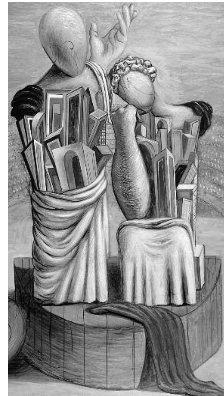
Giorgio de Chirico La commedia e la tragedia 1926, Olio su tela, cm 146 x 114 Mart, VAF Stiftung, Rovereto

5) Cultura della rete Lavorare in rete significa promuovere, facilitare, organizzare l'instaurarsi di legami tra differenti soggetti allo scopo di attivare risposte concrete a bisogni. Questo modo di ragionare e quindi, poi, di operare comporta notevoli elementi di vantaggio. L'ottica della rete va oltre l'ormai superato modello lineare di risposta e permette di affrontare in maniera integrata le differenti sfaccettature di problemi complessi come quelli umani. Si agisce in tal senso su più fronti promuovendo flussi di comunicazione, cercando di favorire l'incontro dei bisogni con le risposte reperibili nell'ambiente, minimizzando gli effetti dispersivi. La valorizzazione e l'ottimizzazione delle risorse esi-