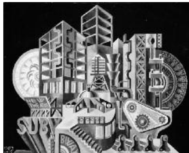
Fortunato Depero "The New Babel" (Scenario plastico mobile) 1930, Tempera su cartoncino, cm 71,3 x 94 Mart, Rovereto

La Carta etica è un documento con cui un'organizzazione esplicita i valori e il patrimonio ideale che sta alla base del patto associativo, assumendo la propria storia e identità come risorsa. Rendere presente la storia di Comunità familiare, il patrimonio esperienziale e professionale comune, permette di richiamare costantemente ai soci le motivazioni fondanti del patto associativo e di costruire nuove ragioni di appartenenza dentro il cambiamento dell'organizzazione.